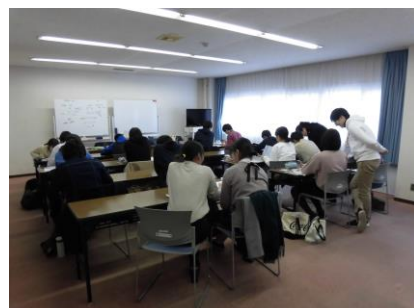
裏面に実施日カレンダーがあります

※新型コロナウイルスの影響により開催の有無・スケジュールは変更になる場合がございます。ご了承ください。